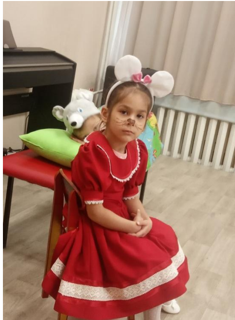
Показ сказки в библиотеке им.Крупской «сказка о глупом мышонке»