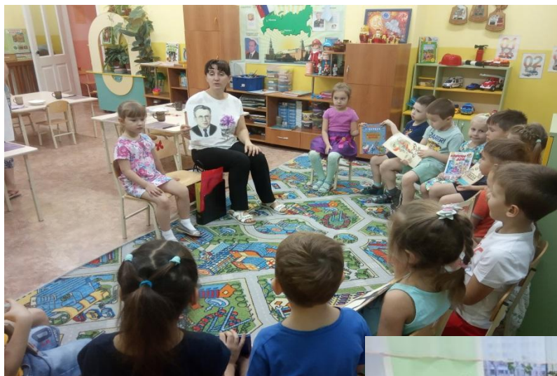
Знакомство с творчеством С.Я.Маршак