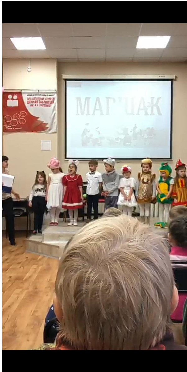
Герои вышли на поклон