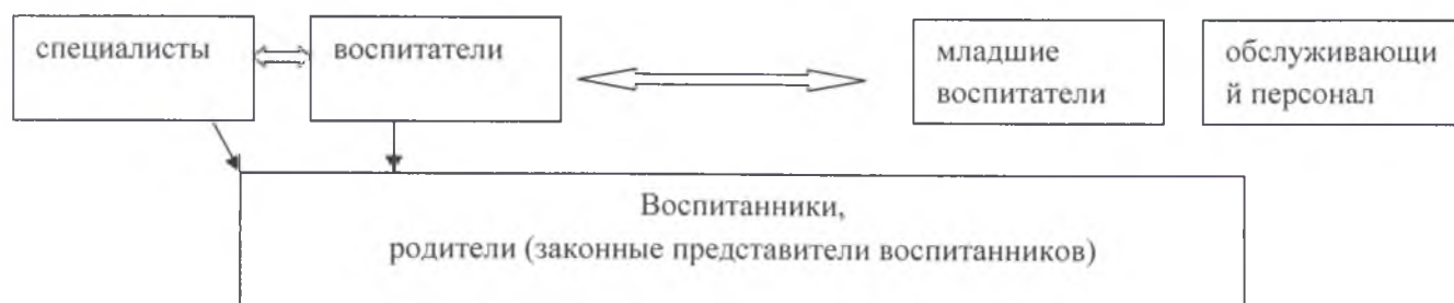
Рис. №1 Модель управления в МБДОУ ЦРР – «Детский сад №199»

Формами самоуправления являются коллегиальные органы управления дошкольного учреждения: